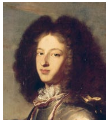
de hertog van Bourgondië