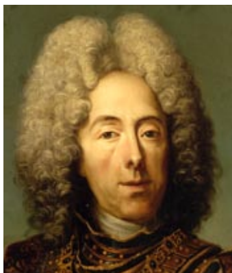
prins Eugeen van Savoye