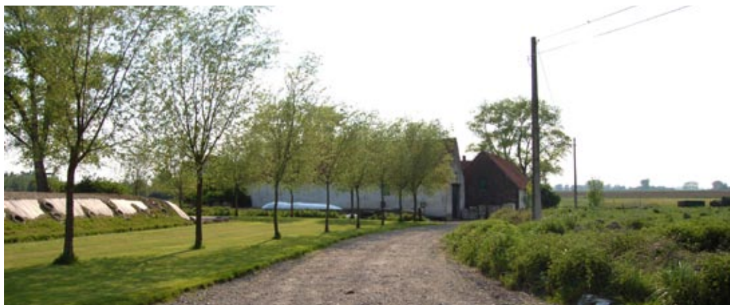
hoeve "t Craeneveld"

Wat verder draaien we links mee in de richting van Mullem. Rechts van ons liggen de Hoge Bunders en verderop, voorbij de expresweg, de Heurnekouter, waar de Geallieerde cavalerie stond opgesteld.