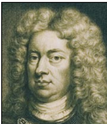
de hertog van Marlborough

Het landschap waar de Slag bij Oudenaarde in 1708 plaats had, is in de loop der jaren niet veel veranderd, al zijn er de laatste jaren enkele verkavelingen bijgekomen. Alleen het uitzicht van het zuidoostelijk deel van het slagveld onderging, met de aanleg van de expresweg naar Gent en van het industrieterrein 'De Bruwaan', een grondige gedaanteverandering.